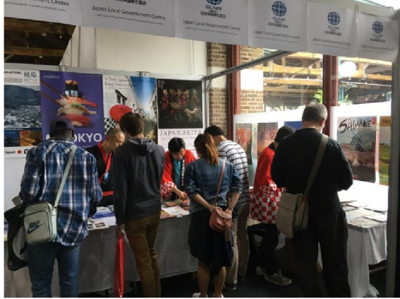
※向かって右手ブースが CLAIR、左手ブースが JNTO